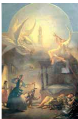
琵拉聖殿裡的古畫，描繪的是聖體奇蹟。