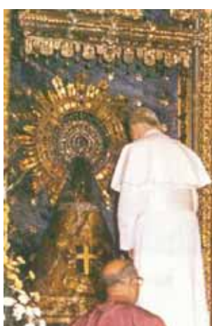
教宗若望保祿二世站在琵拉聖母像前。