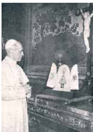
教宗碧岳十二世站在琵拉聖母像前祈禱，好似收到一份珍貴的禮物。