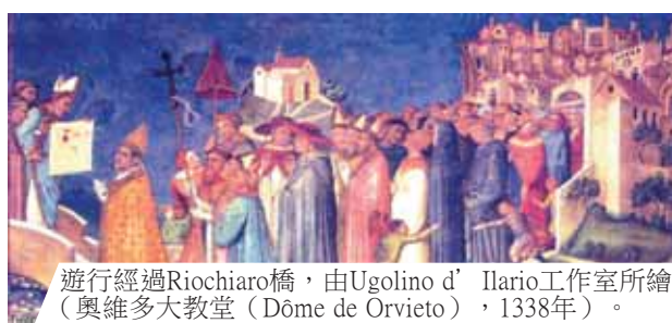
遊行經過Riocchio橋，由Ugolino d' Ilario工作室所繪（奧維多大教堂（Dôme de Orvieto），1338年）。