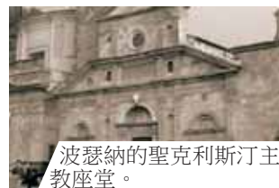
波瑟納的聖克利斯汀主教座堂。