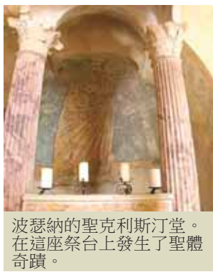
波瑟納的聖克利斯汀堂。在這座祭台上發生了聖體奇蹟。