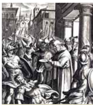
描繪奇蹟的古木雕。