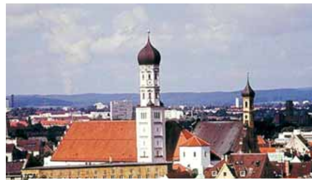
奧格斯堡聖十字架會院